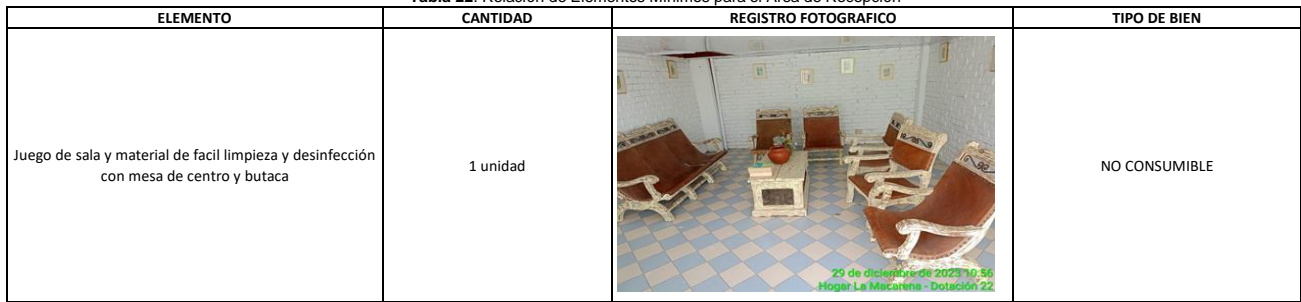
Tabla 22. Relación de Elementos Mínimos para el Área de Recepción